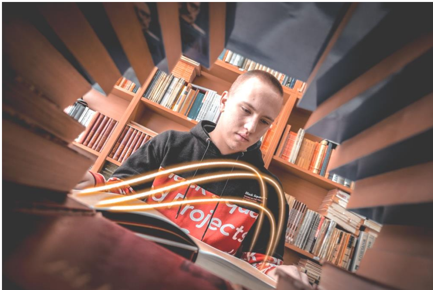
Фото-конкурс „Разгледница из школске библиотеке“

Одлуком Управног одбора Друштва школских библиотекара Србије расписан је четврти по реду Фото-конкурс „Разгледница из школске библиотеке“ са темом „Селфи са омиљеном књигом“, који је завршен 31.03.2021.